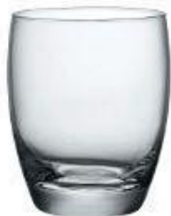
FIORE/ BICCHIERE EAU 30CL 36 CT PROMO