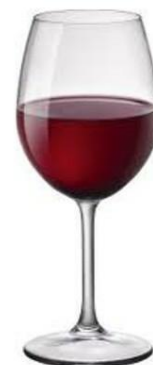
RISERVA/ CALICE NEBBIOLO 49CL