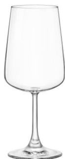
RISERVA/ CALICE ROSSI MATURI 55CL