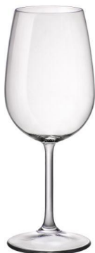
RISERVA/ CALICE BORDEAUX 55CL