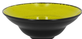
Piatto extra fondo