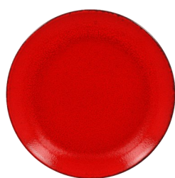
Piatto piano coupe