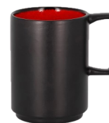
Tazza 8 cm