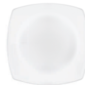
PIATTO PIANO DINNER PLATE

h 28 mm - 1 1/8" Max. □ 266 x 266 mm - 10 1/2" x 10 1/2" CT12 ◊ 6.63661