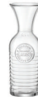
NEW CARAFFA 50 CL CARAFE 16 7/8 OZ

61 cl - 20 5/8 oz h 227 mm - 8 7/8" Max. Ø 81 mm - 3 1/4" CT12 - Q.P. 480 ◊ 5.40639 — 0,5 L