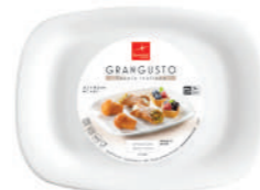
PIATTO PASTICCERIA PASTICCERIA PLATE

h 22 mm - 3/4" Max. □ 280 mm X 210 mm - 11" X 8 1/4" F6 CT12 - Q.P. 1344 ◊ 4.31241.FTB