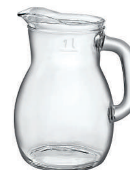
BISTROT 100 CL

117 cl - 39 1/2 oz h 186,5 mm - 7 3/4" Max Ø 147 mm - 5 3/4" CT6 - PRETAGL. - Q.P. 270 ◊ 1.46141 — 1 L