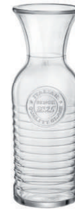
CARAFFA 100 CL CARAFE 33 3/4 OZ

The timeless appeal of vintage style. The collection offers professionals a wide range of solutions and accessories to enhance the service. The new carafes are ideal for serving all types of drinks: from water to cocktails or wine.