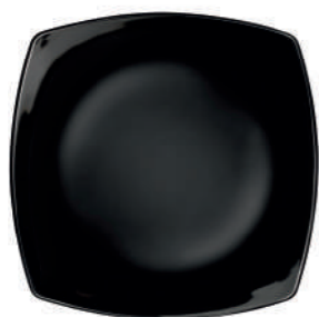
PIATTO PIANO DINNER PLATE

h 28 mm - 1 1/8" Max. □ 266 x 266 mm - 10 1/2" x 10 1/2" CT12 ◊ 6.63610