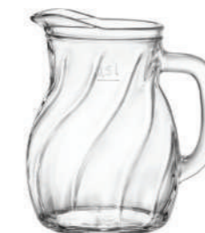
NEW BISTROT TWIST 50 CL

116 cl - 39 1/4 oz h 186,5 mm - 7 1/4" Max Ø 149,5 mm - 6" CT6 - PRETAGL. - Q.P. 270 ◊ 1.46160 — 1 L