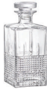
NEW NOVECENTO DECANTER 75 CL

78 cl - 26 3/8 oz h 207 mm - 8 1/8" Max. □ 90 mm - 3 1/2" CT6 ◇ 1.22119