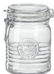
VASO 75 CL JAR 25 1/4 OZ***

89 cl - 30 oz h 136 mm - 5 3/8" Ø 108 mm - 4 1/4" F6 - Q.P. 396 ◊ CT6 - Q.P. 396 ◊ 5.40636