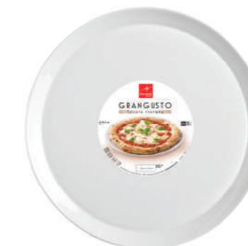
PIATTO PIZZA PIZZA PLATE

h 12 mm - 1/2" Max. Ø 330 mm - 13" F6 CT12 - Q.P. 696 ◊ 4.19320.FTB