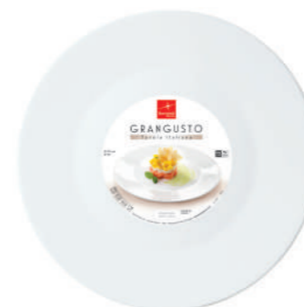
PIATTO MULTIUSO MULTIUSO PLATE

h 19,5 mm - 3/4" Max. □ 217 x 163 mm - 8 1/2" x 6 1/2" F6 CT12 - Q.P. 1800 ◊ 4.31242.FTB