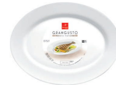
PIATTO PESCE FISH PLATE

h 49 mm - 1 7/8" Max. Ø 295 mm - 11 5/8" F6 CT12 - Q.P. 576 ◊ 4.00850.FTB