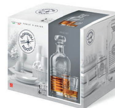
SET SPIRITS 7PZ 7 PCS SPIRITS SET

125 cl - 42 1/4 oz h 207 mm - 8 1/4" Max Ø 109 mm - 4 1/4" SR1 K6 - Q.P. 240 1.40623