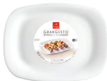
PIATTO BBQ BBQ PLATE

h 31,5 mm - 1 1/4" Max. Ø 317 x 262 mm - 12 1/2" x 10 1/4" F6 CT12 - Q.P. 684 ◊ 4.31290.FTB