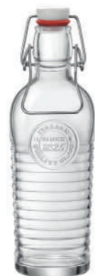
BOTTIGLIA 75 CL* BOTTLE 25 1/4 OZ

78 cl - 26 1/4 oz h 247 mm - 9 3/4" Max. Ø 85,9 mm - 3 1/2" CT6 - Q.P. 408 ◊ 5.40626