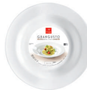
PIATTO PASTA PASTA PLATE

h 49 mm - 1 7/8" Max. Ø 295 mm - 11 5/8" F6 CT12 - Q.P. 576 ◊ 4.00850.FTB