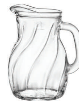
NEW BISTROT TWIST 100 CL

117 cl - 39 1/2 oz h 186,5 mm - 7 3/4" Max Ø 147 mm - 5 3/4" CT6 - PRETAGL. - Q.P. 270 ◊ 1.46141 — 1 L