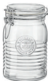
VASO 100 CL JAR 33 3/4 OZ***

24 cl - 8 oz h 110 mm - 4 3/8" Max. Ø 64 mm - 2 1/2" CT12 - Q.P. 1440 ◊ Con capsula in acciaio inox With stainless steel lid 5.40629.MTU