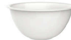
EASY COPPA XL EASY BOWL XL

310 cl - 104 7/8 oz h 118 mm - 4 5/8" Max. Ø 255 mm - 10" F3 / CT6 ◊ 1.23200