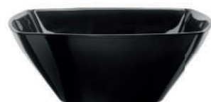
INSALATIERA SALAD BOWL

h 20 mm - 3/4" Max. □ 176 x 176 mm - 6 7/8" x 6 7/8" CT12 ◊ 6.63630