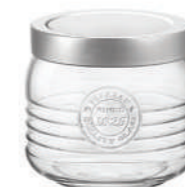
VASO 75 CL JAR 25 1/4 OZ

87 cl - 29 1/2 oz h 107 mm - 4 1/4" Max Ø 119 mm - 4 3/4" CT6 C/ALL - Q.P. 432 ◊ Con tappo in alluminio e polietilene With aluminum and polyethylene lid 5.40622