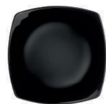
PIATTO DESSERT DESSERT PLATE

78 cl - 26 1/4 oz h 53 mm - 2 1/8" Max. □ 213 x 213 mm - 8 3/8" x 8 3/8" CT12 ◊ 6.63620