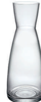
CARAFFA 100 CL CARAFE 33 3/4 OZ

34 cl - 11 1/2 oz h 116 mm - 4 1/2" Max Ø 100,5 mm - 4" B6 K4 - Q.P. 128 CT12 K - Q.P. 64 1.25060