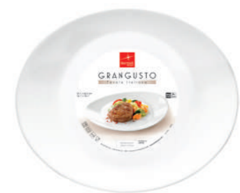
PIATTO STEAK STEAK PLATE

h 27 mm - 1" Max. Ø 350 mm X 267,5 mm - 13 3/4" x 10 1/2" F6 CT12 - Q.P. 672 ◊ 4.00852.FTB