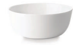
COPPA INSALATA SALAD BOWL

h 18 mm - 6/8" Max. Ø 335 mm - 13 1/4" F6 CT12 - Q.P. 648 ◊ 4.01321.FTB