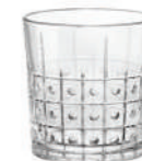
ESTE ACQUA WATER

7,7 cl - 2 1/2 oz h 79 mm - 3 1/8" Max. Ø 55 mm - 2 1/8" B6 K4 - Q.P. 380 1.22117