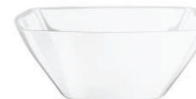
INSALATIERA SALAD BOWL

h 20 mm - 3/4" Max. □ 176 x 176 mm - 6 7/8" x 6 7/8" CT12 ◊ 6.63663