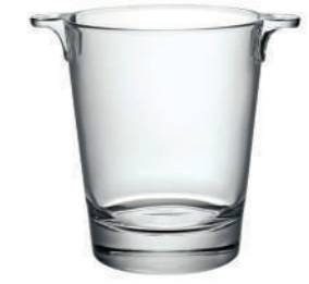
PORTAGHIACCIO ICE BUCKET

38 cl - 12 3/4 oz h 90 mm - 3 1/2" Max Ø 130 mm - 5" CT 12 - Q.P. 540 ◇ C2 K8 - Q.P. 240 3.40750