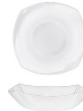
PIATTO FONDO SOUP PLATE

h 28 mm - 1 1/8" Max. □ 266 x 266 mm - 10 1/2" x 10 1/2" CT12 ◊ 6.63661