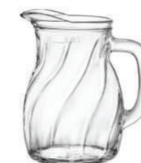
NEW BISTROT TWIST 25 CL

61 cl - 20 3/4 oz h 144,5 mm - 5 3/4" Max Ø 126,5 mm - 5" CT12 - PRETAGL. - Q.P. 432 ◊ 1.46150 — 0,5 L