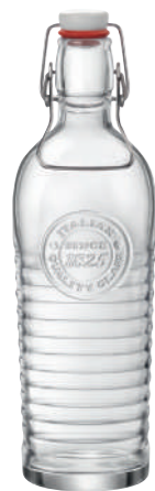
BOTTIGLIA 100 CL* BOTTLE 33 3/4 OZ

116 cl - 39 1/4 oz h 292 mm - 11 1/2" Max. Ø 94,5 mm - 3 3/4" CT6 - Q.P. 288 ◊ SR1 K6 - Q.P. 216 5.40621