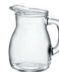
BISTROT 25 CL

31 cl - 10 1/2 oz h 117,4 mm - 4 5/8" Max Ø 102 mm - 4" CT12 - PRETAGL. - Q.P. 960 ◊ 1.46143 — 0,25 L