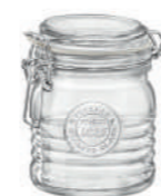
VASO 35 CL JAR 11 3/4 OZ***

44,6 cl - 15 oz h 103 mm - 4" Ø 91 mm - 3 5/8" F6 - Q.P. 768 ◊ CT6 - Q.P. 768 ◊ 5.40638