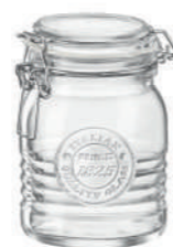
VASO 50 CL JAR 17 OZ***

60,2 cl - 20 1/4 oz h 123 mm - 4 7/8" Ø 96,5 mm - 3 3/4 " F6 - Q.P. 672 ◊ CT6 - Q.P. 588 ◊ 5.40637