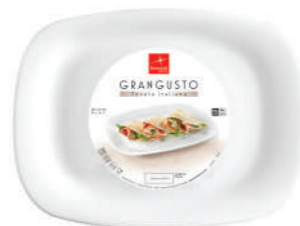
PIATTO PIADINA PIADINA PLATE

h 25,5 mm - 1" Max. □ 330 mm X 240 mm - 13" X 9 1/2" F6 CT12 - Q.P. 720 ◊ 4.31240.FTB