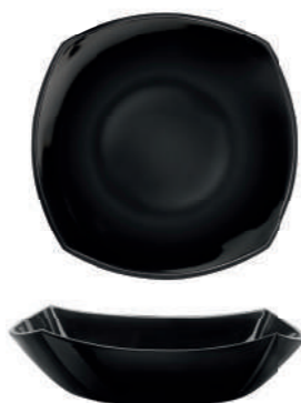
PIATTO FONDO SOUP PLATE

h 28 mm - 1 1/8" Max. □ 266 x 266 mm - 10 1/2" x 10 1/2" CT12 ◊ 6.63610