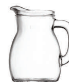
BISTROT 50 CL

63 cl - 21 1/2 oz h 144,5 mm - 5 3/4" Max Ø 124,5 mm - 4 7/8" CT12 - PRETAGL. - Q.P. 432 ◊ 1.46142 — 0,5 L