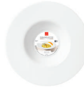
PIATTO RISOTTO RISOTTO PLATE

h 53 mm - 2 1/8" Max. Ø 270 mm - 10 5/8" F6 CT12 - Q.P. 576 ◊ 4.19323.FTB