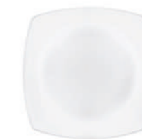
PIATTO DESSERT DESSERT PLATE

78 cl - 26 1/4 oz h 53 mm - 2 1/8" Max. □ 213 x 213 mm - 8 3/8" x 8 3/8" CT12 ◊ 6.63662